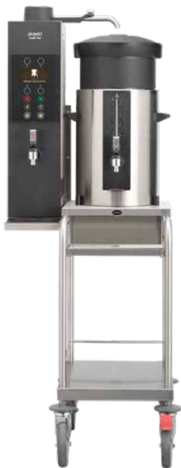
+ Modell J