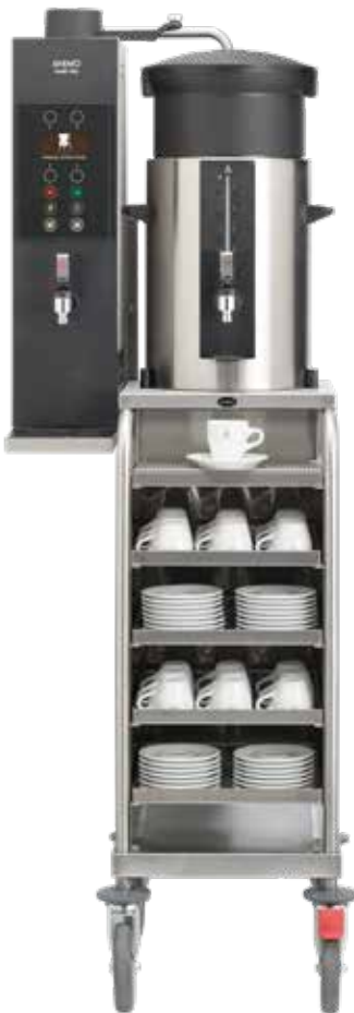
+ Modell JR (Modell ST ist für große Behälter geeignet)