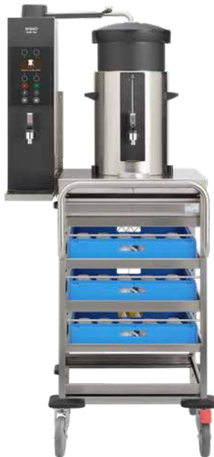
+ Modell SK 10 VL