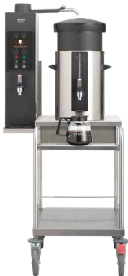
+ Modell S (Modell C ist für 2 Behälter geeignet)